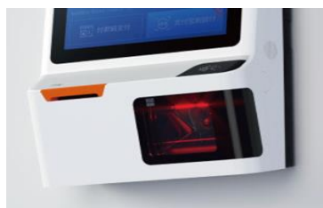
①バーコードスキャナー